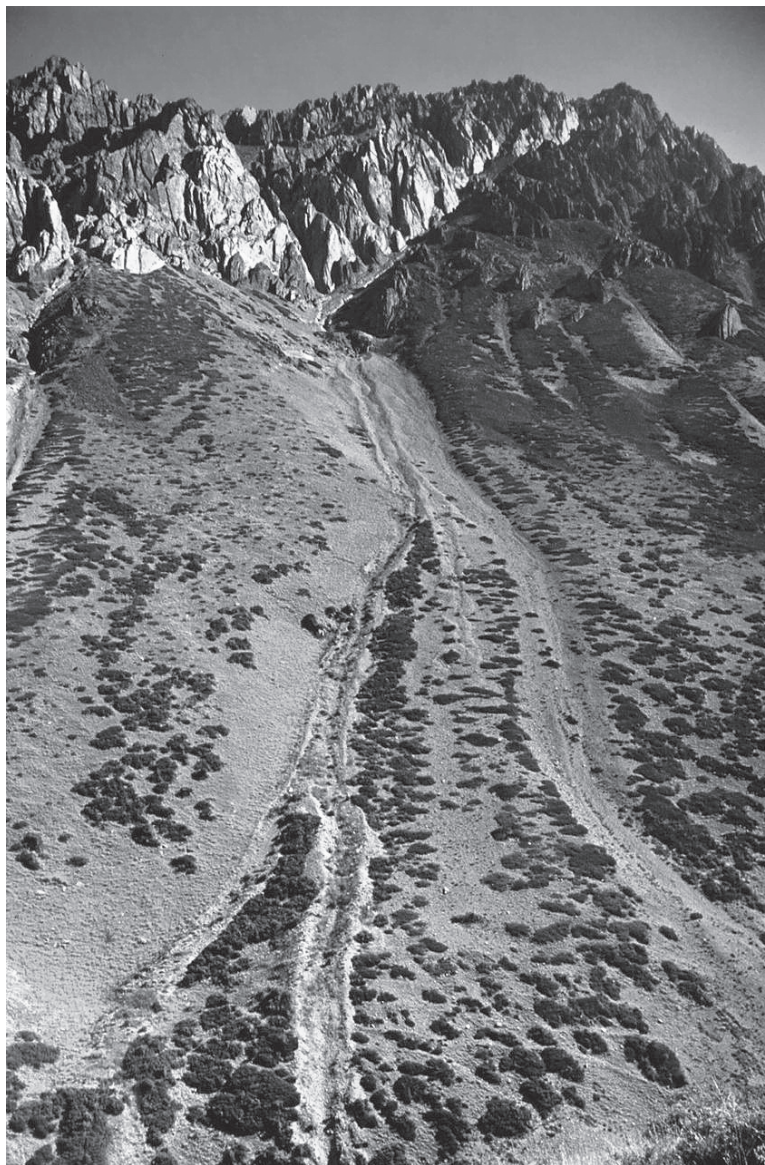
Рис. 2. Южный склон Алатау. Растительность крутых склонов высокогорья в пределах заповедника.

ванию глубоких (1–2 км) узких крутосклонных ( 25^{\circ} – 50^{\circ} , местами до 90^{\circ} ) ущелий. Характерны узкие пилообразные гребни и долины с V-образным поперечным профилем. Долинный комплекс редуцирован: узкое днище практически полностью занято валунистым руслом, пойма встречается фрагментарно, надпойменные террасы отсутствуют. Обломочные шлейфы обычно спускаются со склонов непосредственно в русло. Склоны, как правило, прямые, испещрены врезами-лотками, по которым в холодное время года сходят лавины, в теплое – селевые потоки [12].