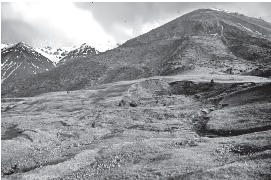
Рис. 5. Оползневой цирк в урочище Улькен-Каинды.

скую бугристо-западинную морфологию 3 . Таких урочищ выделяется семь: Топшаксаз, Курсай, Айнаколь, Кызульген, Улькен-Каинды, Кзылжар и Жетымсай. В них сосредоточены мощные толщи кайнозойских опесчаненных суглинков и элювиальные россыпи коренных пород; все эти отложения сильно переработаны оползневыми процессами.