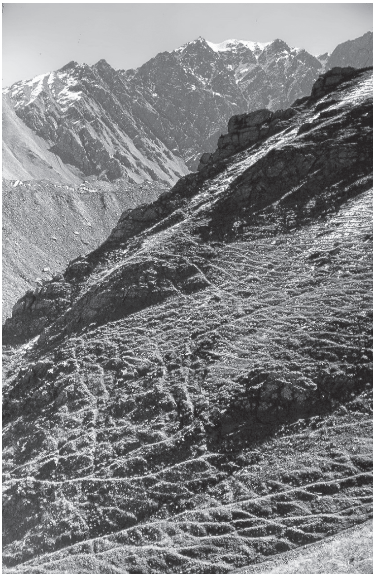
Рис. 3. Склоны высокогорья Таласского Алатау, подверженные выпасу, за пределами заповедника.

пийском поясе. Таким образом, мы имеем две противоположные тенденции: в верхнем ярусе наблюдается активизация процессов за счет увеличения поголовья диких копытных, в среднем и особенно нижнем наоборот — стабилизация, связанная с зарастанием склонов, находившихся некогда под выпасом. Однако однозначно связывать последнее обстоятельство с установлением заповедного режима, видимо, не стоит, поскольку в том же направлении может работать фактор изменения климата в виде уменьшения количества осадков в твердом виде и, соответственно, сокращения лавинно-эрозионной деятельности.