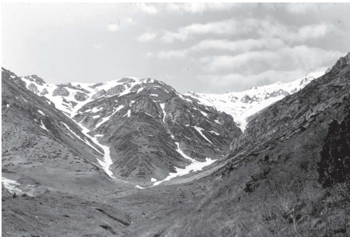
Рис. 4. Лавинные аппараты в урочище Улькен-Каинды.

ний. Выделяются два разноориентированных участка этой зоны, которые в месте стыка образуют почти прямой угол в районе западного окончания Алатау (верховья Ирису, Ргайлы и Жетым-сая): субширотный северный участок — между высокогорьем Алатау и среднегорьем Джабаглы, и субмеридиональный западный участок — при переходе высокогорья к плато и окружающему его плоскогорью. Геоморфологическое строение зоны сочетает как переходные варианты между разделяемыми этими зонами типами рельефа, так и специфические, присущие только ей черты.