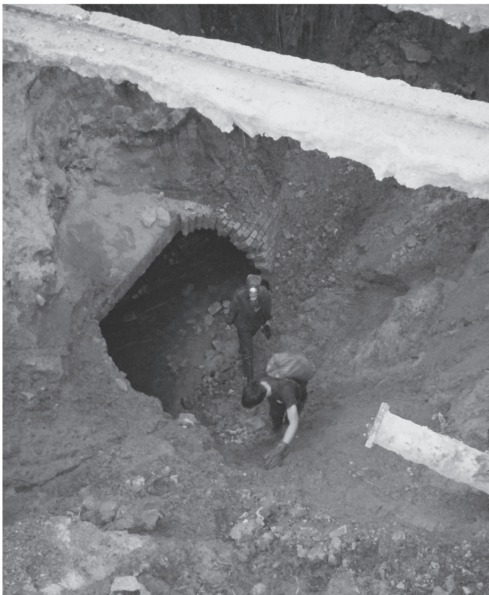
Рис. 2. Провал глубиной около 10 м на месте разрушения коллектора р. Сырец в Киеве в 2014 г. Фото Н.В. Коробко.

ны. Подъем уровней грунтовых вод (подтопление) приводит к заболачиванию почвы, смене в ней окислительно-восстановительной обстановки; меняются состав, разнообразие и биомасса почвенной флоры и фауны; снижается аэрация корнеобитаемого слоя, и часть деревьев погибает, существенно изменяется видовой состав кустарников и травянистой растительности; увеличивается влажность приземного слоя воздуха, что негативно сказывается на здоровье людей (Геоэкология..., 1996).