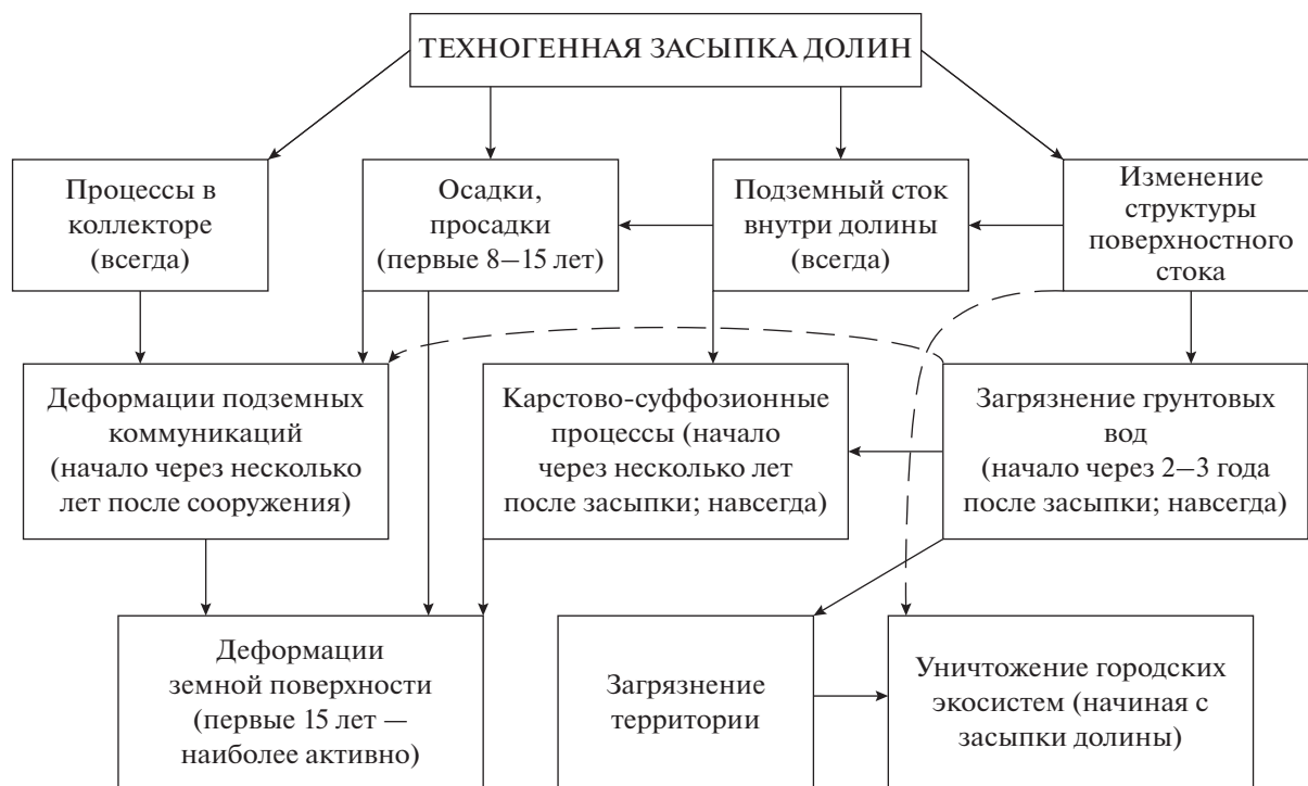
Рис. 3. Организация процессов—последствий техногенного уничтожения гидросети городов на платформенных территориях (на примере Москвы).