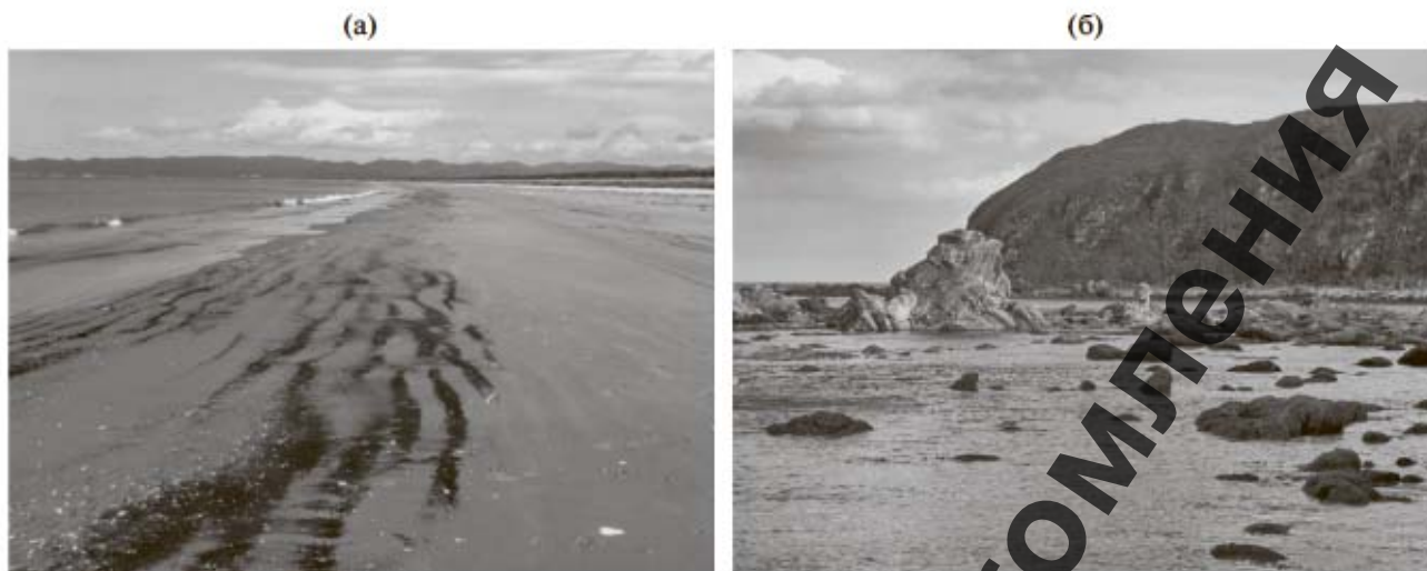
Рис. 2. Участки берега о-ва Сахалин: (а) зал. Мордвинова, (б) м. Сенявина–м. Острый.

носит преимущественно локальный характер. В среднем коэффициент техногенной нагрузки колеблется от 0.001 до 0.05 в заливе Мордвинова [7].