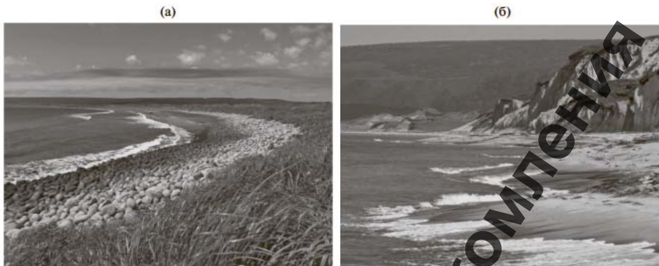
Рис. 3. Участки берега о-ва Итуруп: (а) зал. Касатка, (б) ул. "Белые скалы".